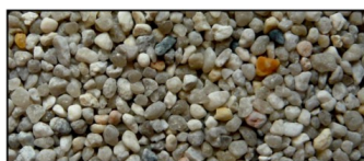
F.F-Kvarts, 2-4 mm