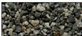
50-50 Grå og sort Granitt, 1-3 mm